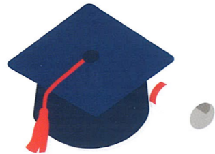
자녀 학자금 지원