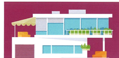
리조트 회원권 이용