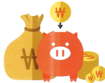
장기근속 수당 및 포상