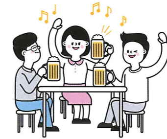
동호회 활동 지원